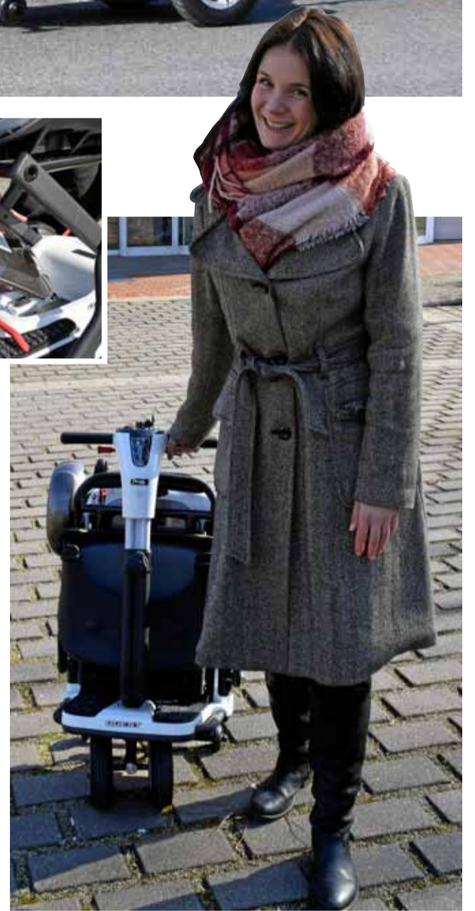
HANDLICH WIE EIN REISEKOFFER: Das zusammengefaltete E-Mobil ist kompakt, lässt sich gut schieben oder hinterherziehen.