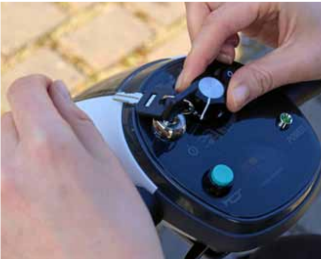
DA GEHT NOCH WAS: Die Reporterin drehte die PS-Zahl zu Anfang ihrer Probefahrt gleich mal hoch. Und dann ging's auf die Straße.