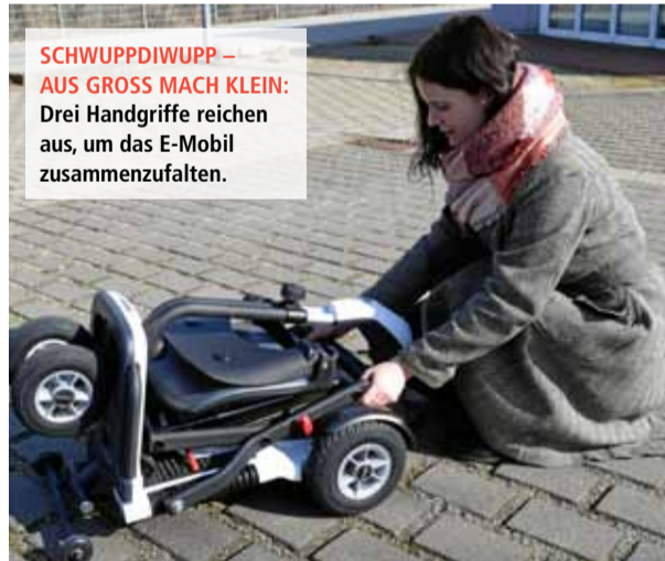
SCHWUPPDIWUPP – AUS GROSS MACH KLEIN: Drei Handgriffe reichen aus, um das E-Mobil zusammenzufalten.